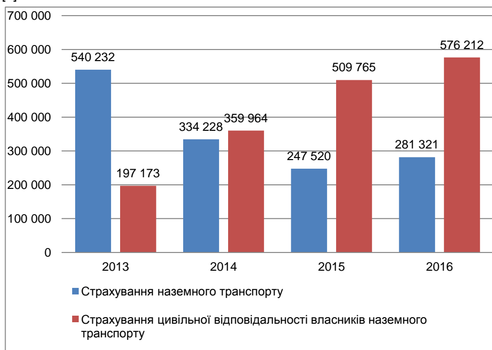
Рис. 2 Кількість договорів страхування, укладених протягом 2013-2016 рр.

Також варто відзначити, що вітчизняний ринок автострахування характеризується значним рівнем шахрайств як з боку страхових агентів, страхових компаній та клієнтів, так і іноземних груп страхових шахраїв (у випадку міжнародного автострахування). Страхова статистика в Україні щодо шахрайства не ведеться, проте, за різними даними, збиток страхових компаній від дій шахраїв складає 10-15%, а в деяких компаніях - до 25 % від загальної суми страхового відшкодування [5].