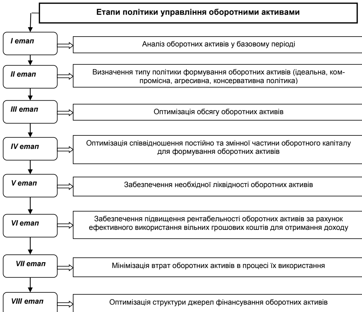
Рис. 2. Етапи політики управління оборотними активами підприємства

Ефективна політика управління оборотним капіталом повинна орієнтуватися на шляхи вдосконалення використання оборотних активів підприємством, а саме: зменшувати частку дебіторської заборгованості в структурі оборотних активів, що призведе до прискорення оборотності дебіторської заборгованості та оборотного капіталу; збільшувати обсяг запасів, сировини та матеріалів; підтримувати баланс власного оборотного капіталу, щоб не виникло нестачі або надлишку і як наслідок призведе до уповільнення оборотності, зниженню рентабельності, згорання обсягів виробництва, кризи неплатоспроможності; потрібно своєчасно використовувати тимчасово вільні кошти для поточних фінансових інвестицій, які можуть принести додатковий дохід і підвищити рентабельність використання оборотних активів; забезпечувати безперебійність поставок сировини, матеріалів та запасів, вчасно поновлювати обсяг запасів; зменшувати частку активів, які обертаються повільно та відповідно нарощувати активи, період оборотності яких менший; вчасно орієнтуватися в виборі доцільності стратегії фінансування оборотних активів; мінімізувати інфляційні ризики та втрати від простроченої дебіторської заборгованості, зберігання ресурсів для виробництва тощо.